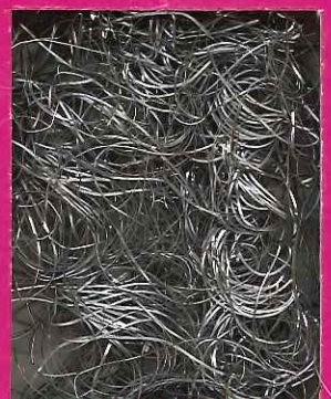
ULTRA-GROB MOLTO GROSSA